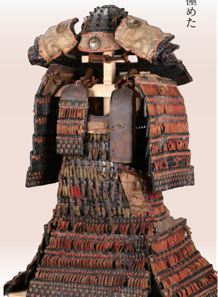
国宝 赤糸威鎧（兜、大袖付） 岡山県立博物館

本展覧会では、天下に名だたる大鎧の双璧として知られている青森県櫛引八幡宮の赤糸威鎧（菊一文字の鎧兜）と春日大社の赤糸威大鎧（竹虎雀飾）が史上初めて並列展示されるとともに、現存する国宝の甲冑類の半数が一堂に集まります。