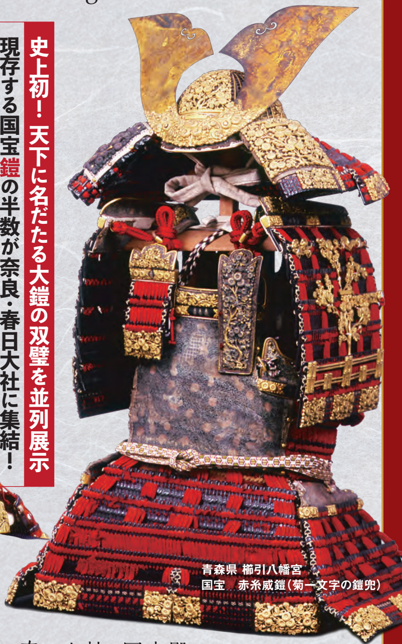
青森県 櫛引八幡宮 国宝 赤糸威鎧(菊一文字の鎧兜)

史上初！天下に名だたる大鎧の双璧を並列展示 現存する国宝鎧の半数が奈良・春日大社に集結！