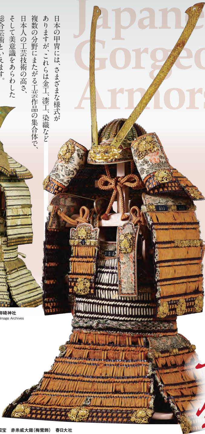
国宝 赤糸威大鎧（梅鶯飾） 春日大社