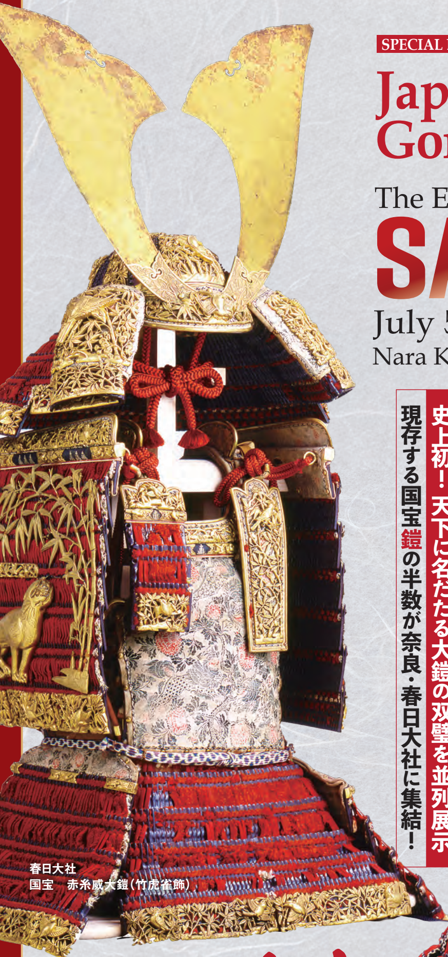
春日大社 国宝 赤糸威大鎧(竹虎雀飾)

史上初！天下に名だたる大鎧の双璧を並列展示 現存する国宝鎧の半数が奈良・春日大社に集結！