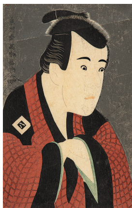
東洲斎写楽 《三代目市川八百蔵の田辺文蔵》 江戸時代・寛政6年(1794)