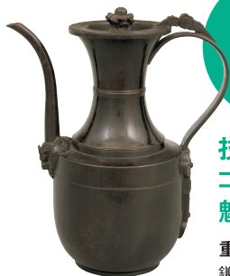
重要文化財《銅湯瓶》 鎌倉時代