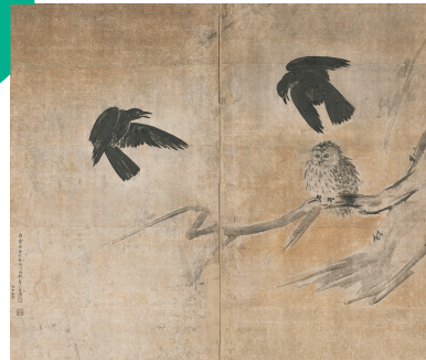
長谷川等伯《烏巢図屏風》 桃山時代・慶長12年(1607)