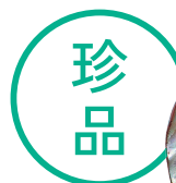
《養亀蒔絵杯》 江戸~明治時代