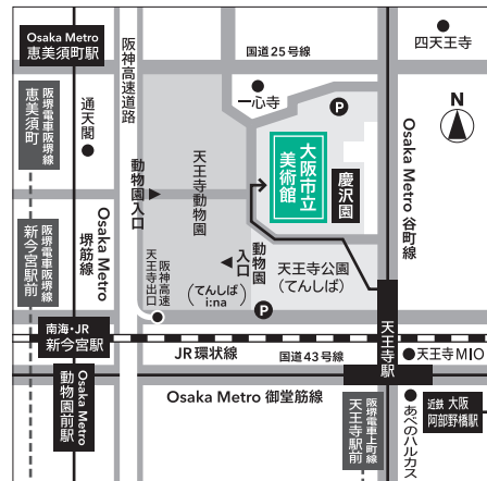
◎ アクセス JR・Osaka Metro天王寺駅、近鉄大阪阿部野橋駅 下車、北西へ約400m

公式オンラインチケット(当館ホームページ内)、チケットぴあ(Pコード:687-029)、ローソンチケット(Lコード:52389)、セブンチケット(セブンコード:107-252) 他